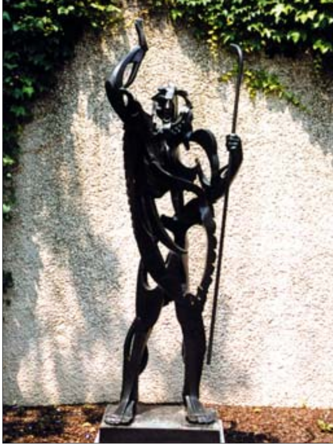
7. Pablo Gargallo, Prorok , 1933 r. (odlew 1954-68 r.), brąz, dar Józefa Hirshhorna z 1972 r.