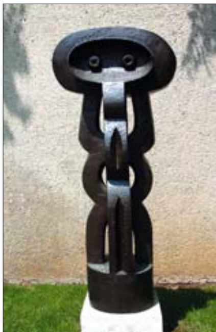
11. Jacques Lipchitz, Postać , 1926-30 r. (odlew 1958-61 r.), brąz, dar Józefa Hirshhorna, 1966 r.