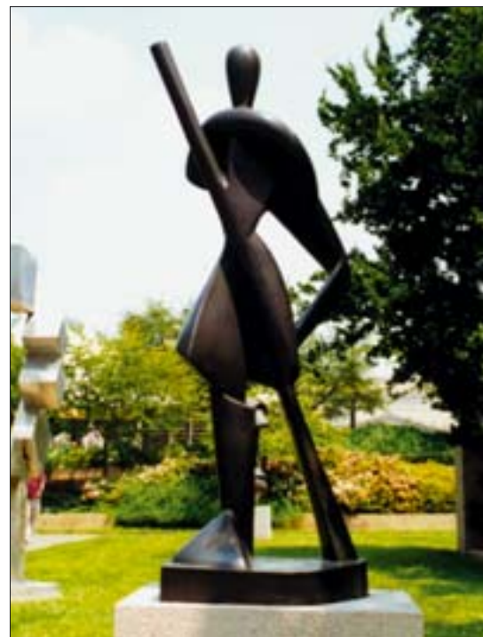
8. Alexander Archipenko, Gondolier , 1914 r. (powiększenie i odlew 1957 r.), brąz, dar Józefa Hirshhorna z 1966 r.