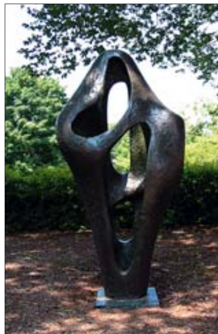
12. Barbara Hepworth, Postać krajobrazowa , 1960 r. (odlew 1965 r.), brąz, dar Józefa Hirshhorna z 1966 r.