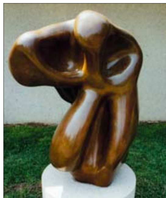
9. Jean Arp, Ewokacja formy: ludzkiej, księżycowej, spektralnej , 1950 r. (powiększenie i odlew 1957 r.), brąz, dar Józefa Hirshhorna z 1966 r.

W ciągu 30 lat istnienia muzeum zorganizowało wiele ciekawych wystaw czasowych. Pierwszą z nich przygotowano z okazji 200-lecia Stanów Zjednoczonych i zatytułowano „Złote wrota. Artyści – imigranci w Ameryce, 1876-1976”. Poświęcona była wkładowi urodzonych poza Stanami Zjednoczonymi artystów w tworzenie sztuki amerykańskiej. Z okazji 10-lecia istnienia muzeum można było oglądać wystawę „Zawartość. Współczesne podejście, 1974-1984”, jedną z pierwszych w Ameryce wystaw zbiorowych związanych z postmodernizmem. W latach 80. wystawa zatytułowana: „Rosyjskie i sowieckie malarstwo, 1890-1930. Wybrane eksponaty z Moskwy i z St. Petersburga”, cieszyła się dużym powodzeniem. Zaprezentowano na niej prace rzadko widziane w Ameryce. Lata 90., to wystawa: „Modernizm – czwórka pionierów z Ameryki Łacińskiej: Diego Riviera, Joaquin Torres-Garcia, Wilfredo Lam, Matta”, zorganizowana dla upamiętnienia 500. rocznicy odkrycia Ameryki przez Krzysztofa Kolumba. Z okazji 25-lecia muzeum urządzono wystawę zbiorową, pod tytułem: „W sprawie piękna. Spojrzenie na ostatnie lata XX wieku”, która była również pokazywana w Monachium. W 2000 r.