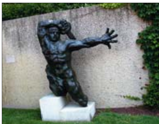
4. Emile Antoine Bourdelle, Wojownik z Montauban , 1898-1900 r. (odlew 1956 r.), brąz, dar Józefa Hirshhorna z 1966 r.