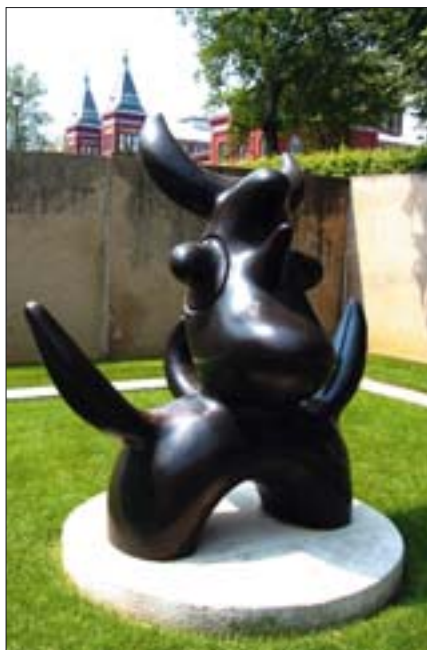
10. Joan Miró, Księżycowy ptak , 1944-46 r. (powiększenie i odlew 1966-67 r.), brąz, dar Józefa Hirshhorna z 1972 r.