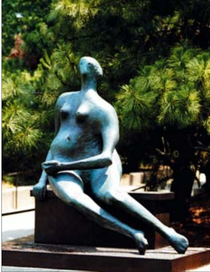
5. Henry Moore, Siedząca kobieta , 1956-57 r., brąz, zapis Józefa Hirshhorna z 1981 r.